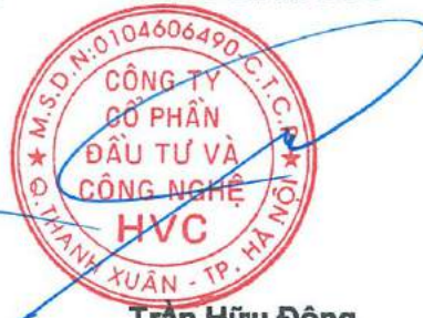
Trần Hữu Đông