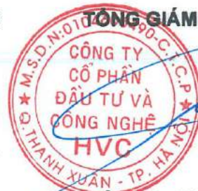
Trần Hữu Đông