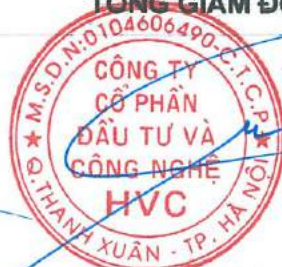
Trần Hữu Đông