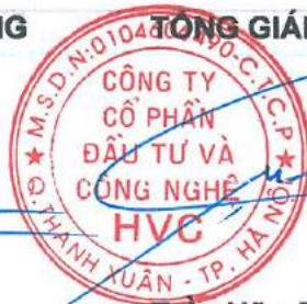
Trần Hữu Đông